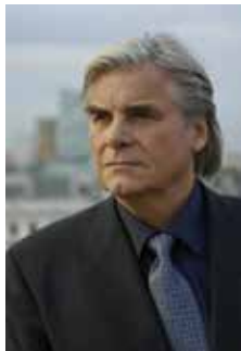
Peter Simonischek als Winfried / Toni Erdmann

Fortsetzung der Serie wichtigster Spielfilme der Filmgeschichte in Zusammenarbeit mit Filmkritikern der Abendzeitung München. Mit Einführung und anschließender Diskussion. Peter Simonischek und Sandra Hüller spielen Vater und Tochter in dem komödiantischen Familiendrama. Der Film hatte seine Premiere im Mai 2016 beim Wettbewerb des 69. Filmfestivals von Cannes. Zu seinen zahlreichen Auszeichnungen gehören der Europäische Filmpreis und eine Oscar-Nominierung.